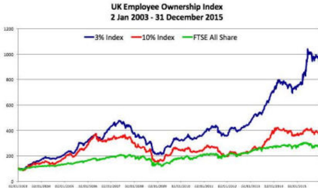
Slika 4.1: Primerjava gibanja indeksa delničarstva zaposlenih – 10-odstotnega EOI in 3-odstotnega EOI z indeksom FTSE All-Share