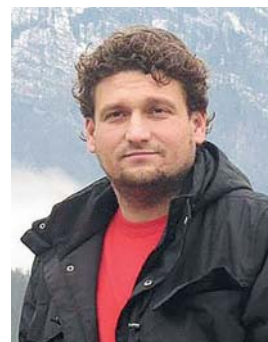
Piše: Asmir Bečarević