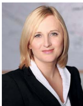
Piše: Tadeja Jegrišnik

z delodajalcem in pomagati pri vključevanju v delo invalidom, starejšim in drugim delavcem, ki potrebujejo posebno varstvo. Za izvajanje naštetega moramo biti korektno in ne zavajajoče obveščeni s strani delodajalca o finančnem položaju podjetja, razvojnih ciljih, strategijah in uresničevanju le-teh, o spremembah v organizaciji in tehnologiji dela, bilanci uspeha in stanju sredstev. Skratka, delavci moramo imeti pravico do vpogleda v dokumentacijo o poslovanju podjetja in pravico do soupravljanja. Našteto je izrednega pomena za naše uspešno delo, počutje in medsebojne odnose ter spodbujanje ustvarjalnega in delovnega kolektivnega duha, ki ga v teh časih tako potrebujemo v vseh poklicnih skupinah v Premogovniku Velenje.