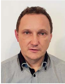
Piše: Danilo Rednjak