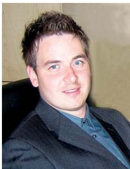
Piše: Mitja Gostiša

ZUDDob, ne deluje, saj je bilo doslej v register pogodb, ki ga vodi MGRT, vpisanih le 67 sporazumov. Če odštejemo povezane družbe, pa je okvirno število družb, kjer so delavci udeleženi pri dobičku, le okoli 30 . Razen nekaterih izjem gre za manjša domača podjetja v zasebni lasti.