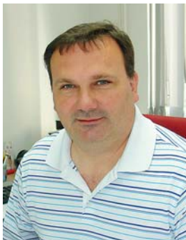
Piše: Simon Lamot