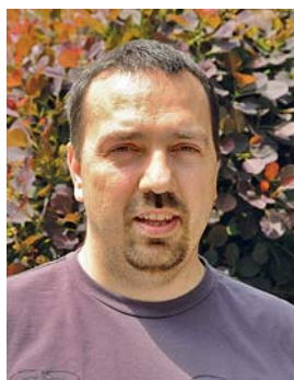
Piše: Niko Filipović