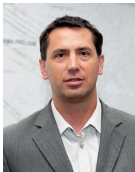
Piše: Ivan Pohorec

delavcev v skupini dana možnost postavljanja pogojev dela, varnosti in humanizacije pri delu razvoja zaposlenih . Ob ravnanju skupne problematike ter vključevanje vsebin, ki se nanašajo na možnosti soupravljanja, v programe izobraževanja zaposlenih ter strokovna pomoč svetu delavcev spodbuja produktivno sodelovanje in povezave med strokovno kadrovske dejavnostjo in delovnimi predstavništvi.