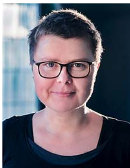
Piše: dr. Karolina Babič

Schwab, K. (2016). Četrta industrijska revolucija, World Economic Forum, Ženeva; slovenski prevod: Igor Pauletič; dobljeno na spletu 10. 5. 2017.