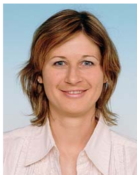
Piše: mag. Leja Drofenik Štibelj