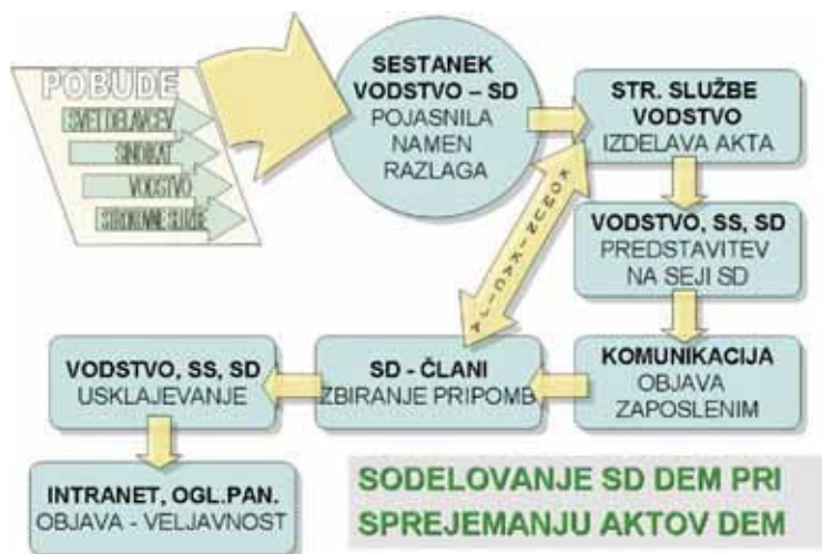
Slika 2: Sodelovanje SD pri sprejemanju aktov družbe

Elektrogospodarstvo je tehnično gledano celota. Pripadnost zaposlenih EG podjetjem je izredno visoka, prav tako tudi naša odgovornost za varno in zanesljivo oskrbo gospodarstva in gospodinjstev z električno energijo. Električna ni dobrina, katera je kar tako »že v vtičnici«. Potrebno jo je proizvesti, transportirati in distribuirati. Žal se v zvezi z EG podjetji pojavlja vse preveč lobijev, osebnih interesov in političnih ter kadrovske igrice. Le-te lahko preprečimo s složnim proaktivnim delovanjem vseh zaposlenih . Zato bo v letošnjem letu SD DEM vložil oziroma nadaljeval napore za ustanovitev panožnega združenja SD elektrogospodarstva, seveda v sklopu in s strokovno pomočjo ZSDS.