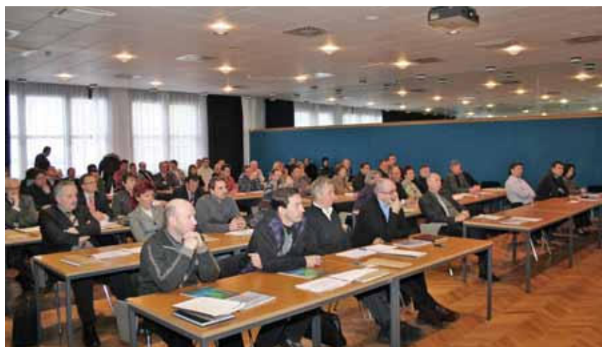
S študijskega srečanja članov ZSDS v Dravskih elektrarnah Maribor

ČHE Kozjak in njena povezava z RTP Maribor je ta trenutek najpomembnejši