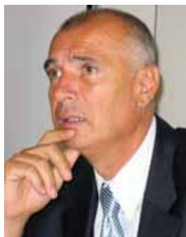
Piše: dr. Mato Gostiša

smo zavrgli vse staro, tudi če je bilo dobro. Sedaj pa je čas, da prestopimo v novo kvaliteto, mar ne?