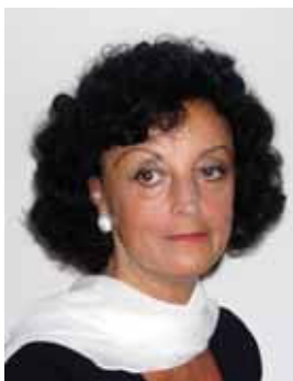
Piše: mag. Cvetka Peršak