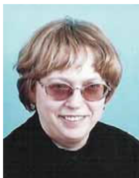
Piše: Ksenija Marčič