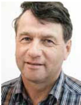
Piše: Bojan Majhenič