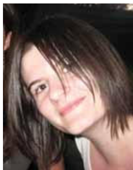
Piše: Nina Bakovnik