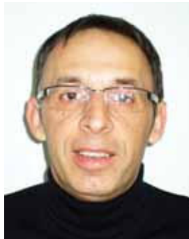
Piše: Peter Andrejek

Naloga odbora v prihodnosti je, poleg že naštetih dejavnosti in predvsem ohranitve obstoječega obsega kapacitet, tudi vzdrževanje objektov v takšnem stanju, da bo omogočena nemotena uporaba in s tem doseženo zadovoljstvo koristnikov. Za objekte, za katere ocenjujemo, da so na manj atraktivnih lokacijah, s čimer je povezana tudi manjša zainteresiranost zaposlenih za koriščenje, bomo poskušali nadomestiti z drugimi , pri izbiri možnih lokacij pa bomo v prvi vrsti upoštevali želje zaposlenih in seveda možnosti, ki bodo na razpolago.