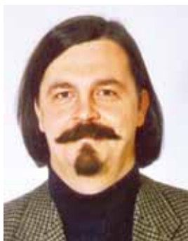
Piše: Vladimir Šega