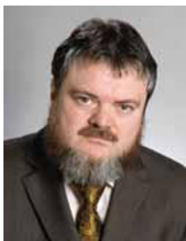
Piše: Silvester Medvešček