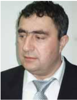
Piše: Marjan Kirbiš

Ker varnost in zdravje pri delu zahtevata vsakodnevno aktivnost vseh zaposlenih, nadrejenih, vodij in družbe kot celote nam dela zagotovo ne bo zmanjkalo, saj verjamemo, da je vedno mogoče delati še bolje in učinkoviteje.