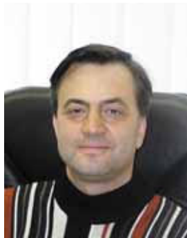
Piše: Tomaž Markelj