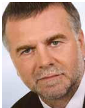
Píše: mag. Rajko Bakovnik

Kriza in sindikati – pogled s sindikalne strani