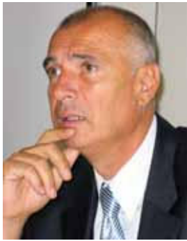
Piše: dr. Mato Gostiša

Ekonomski demokracija kot alternativa »meznemu kapitalizmu«