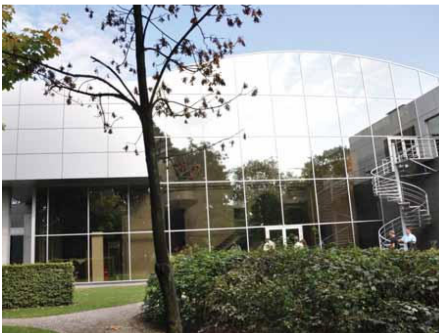
Sindikalni izobraževalni center v Elewijtu blizu Bruslja.

Belgijski socialni dialog poteka na treh ravneh: nacionalni, panožni in na ravni družbe. Na nacionalni ravni socialni partnerji komunicirajo zlasti v okviru nacionalnega delavskega sveta (angl. National Labour Council); na panožni ravni oblikuje skupne (mešane) odbore, na ravni družbe pa se delodajalec pogovarja s sindikalnimi predstavništvi, sveti delavcev in odbori za varnost in zdravje pri delu. Vsaka raven ima