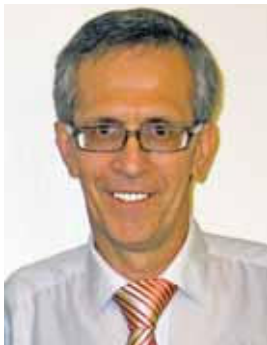
Piše: Alojz Boc

čil – v nasprotju s pričakovanji sindikatov žal ni v ničemer pripomogel vsaj k ohranjanju, kaj šele povečevanju članstva v sindikatih , temveč morda kvečjemu ravno nasprotno, bi bilo njegovo nadaljnje ohranjanje v Zkolp brez dvoma še posebej nerazumno. Predpostavka, da je vzrok za upadanje članstva v sindikatih predvsem obstoj svetov delavcev (in njihovo more-