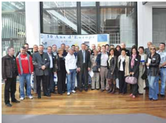
Na sedežu Evropske komisije nas je med drugimi sprejel tudi evropski komisar iz Slovenije dr. Janez Potočnik.

Izredno poučen in najtesneje povezan s prakso je bil v nadaljevanju obisk kongresnega središča (v Elewijtu) največjega belgijskega sindikata ACV-CSC s skoraj 1.700.000 člani, posebej njegovega panožnega sindikata kovinske industrije Z zanimanjem