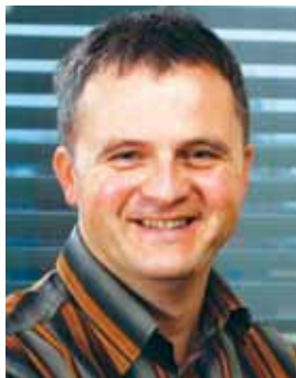
Piše: Milan Malovrh