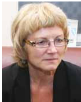
Piše: Nevenka Dobljekar

S strokovne ekskurzije ZSDSP v Belgiji in na Nizozemskem