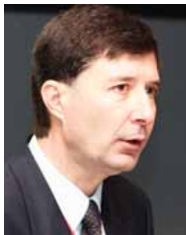
Piše: Emil Osterc