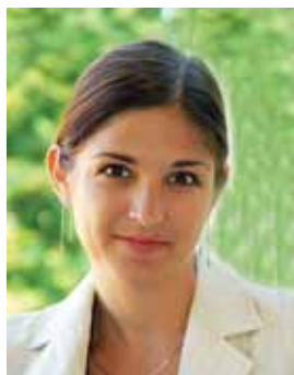
Piše: dr. Valentina Franca