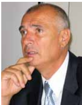
Piše: dr. Mato Gostiša

Nihče, ki se zaveda globine trenutne gospodarske krize, seveda ne nasprotuje temu, da tudi zaposleni z določenimi »prostovoljnimi« odrekami svojim že pridobljenim pravicam (če so seveda pri posameznem delodajalcu izpeljana po zakonitem postopku) poskušajo v okviru objektivnih možnosti prispevati k ohranjanju nadaljnega poslovanja »svojih« pod-