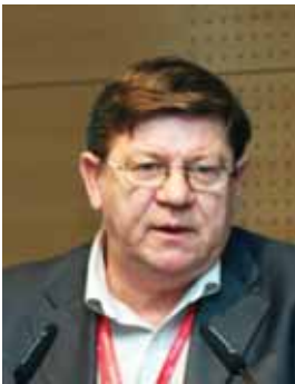
Piše: Milan Rihter

Vir: Kodeks upravljanja javnih delniških družb, http://www.uradni-list.si/1/objava.jsp?urlid=2005118&stevilka=5302