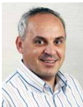
Piše: Janko Gorjanc