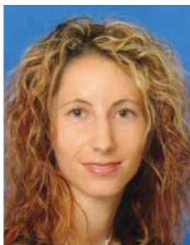
Piše: Barbara Lužar