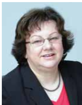
Piše: Darja Senica

Moj način vodenja sveta delavcev temelji na doslednem spoštovanju demokratičnih načel . Prepričan sem, da je ob izobraževanju članov sveta delavcev prav demokratično delovanje, izčrpna diskusija na sejah sveta delavcev in poslušanje vsakega sogovornika zagotovilo za uspešno delovanje sveta delavcev.