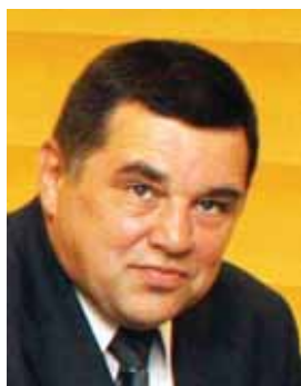
Piše: Martin Gorišek

Še enkrat bi poudaril, da dobro sodelovanje med soupravljalci, kadrovske službe in vodstvom podjetja pomeni uspeh za podjetje in delavce.