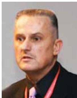
Piše: Branko Sparavec